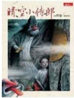
天下雜誌 文:哲也/圖:唐唐

但隨著故事情節慢慢進入,加上裕峰想到用昏暗的燈光,來營造符合這 "鬼故事" 的氛圍,小朋友果然開始跟著很入戲,露出有點害怕又有點好奇故事會如何發展的表情。